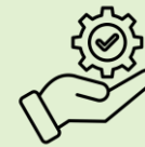
Entreprises de service à l'industrie